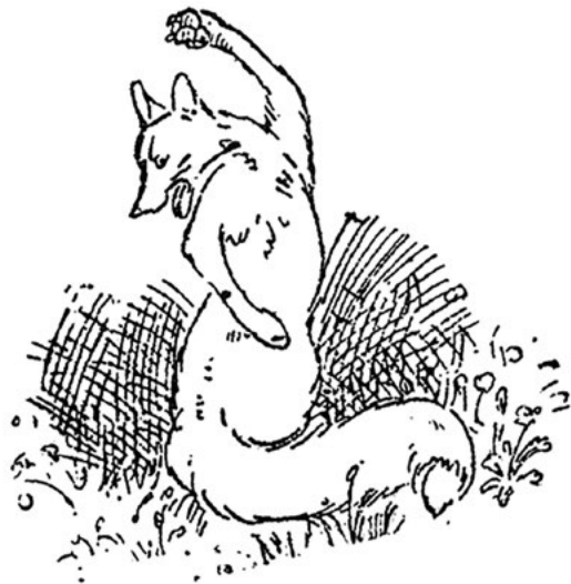
Liška Bystrouška – původní kresba Stanislava Lolka z Lidových novin