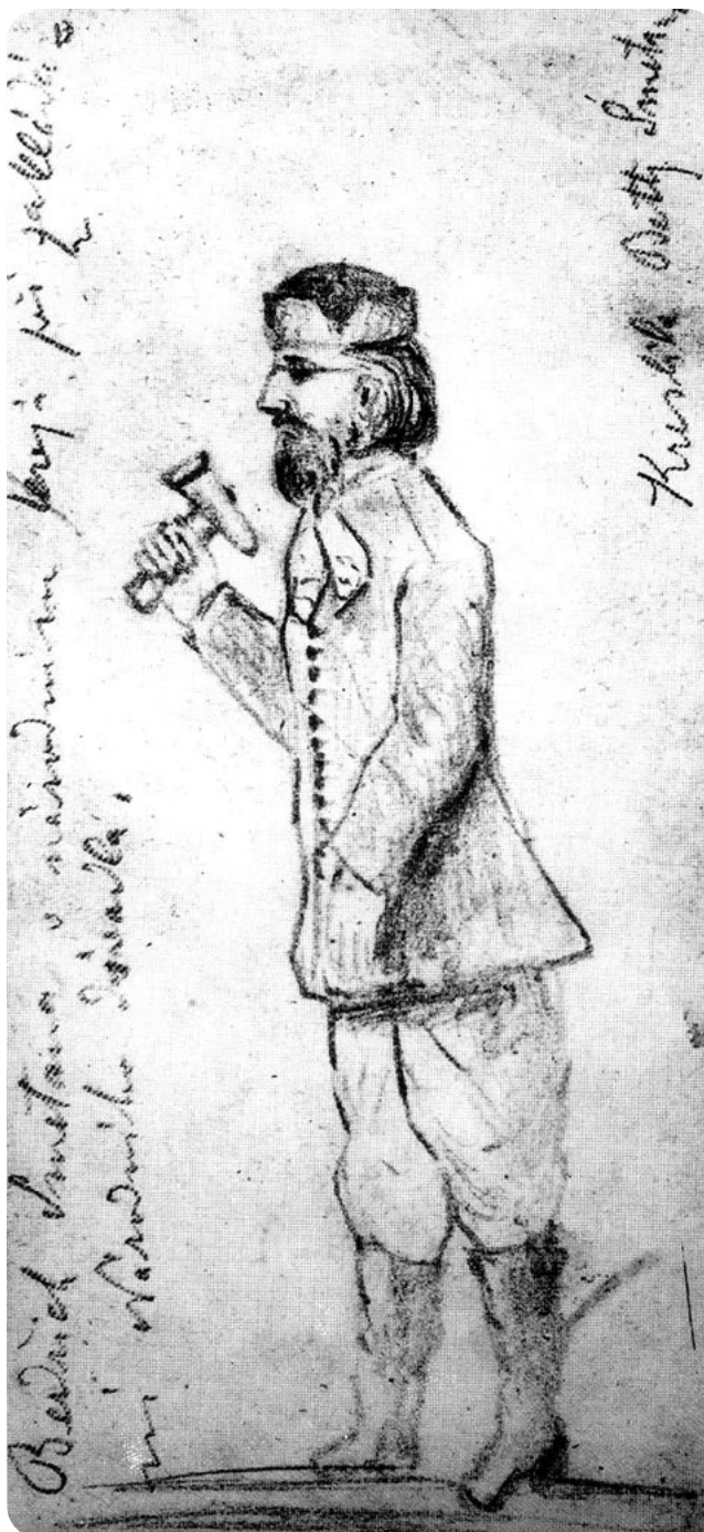
Smetana poklepává na základní kámen Národního divadla. Kresba Betty Smetanové.