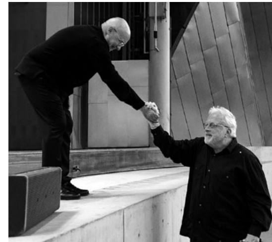
S Williamem Bolcomem

Jako hostující dirigent několikrát vystoupil prakticky se všemi špičkovými americkými orchestry a několika nejvýznamnějšími orchestry evropskými. Vedl významné nové inscenace na festivalu v Bayreuthu, Salcburském festivalu, v Bavorské státní opeře, Chicagské lyrické opeře a Metropolitní opeře.