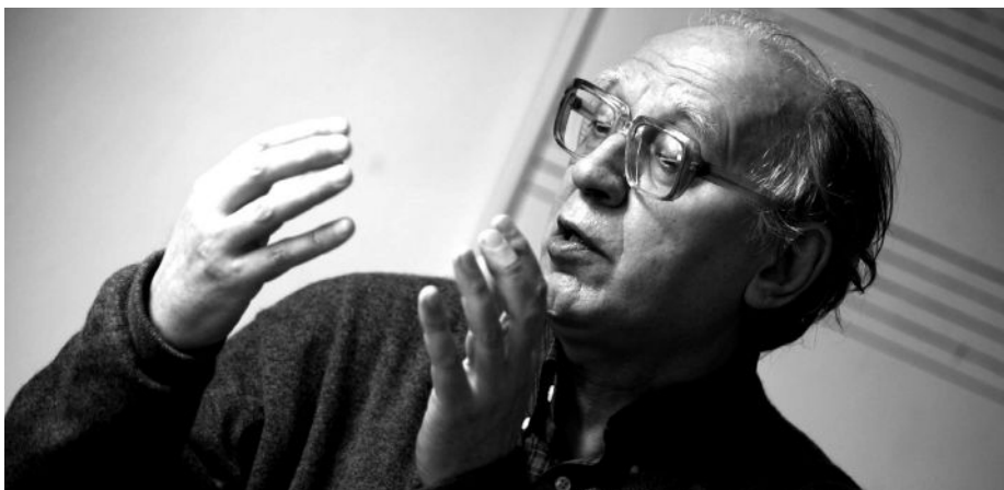
Valentin Silvestrov na FF MU v Brně, 2010

současné ukrajinské kultury, který měsíc předtím za dramatických okolností opustil Rusy pustošenou Ukrajinu a od té doby žije v Berlíně. Na youtube hojně zdokumentovaný incident, proběhnoucí paradoxně až ve druhé, schubertovské polovině večera, ovšem poté, co se úřady neúspěšně pokoušely vyprodaný koncert zrušit už během dne, má všechny atributy gogolovské satiry. Dva policisté nejprve nakráčejí na pódium a hlasitě oznámí ukončení koncertu. V sále je rušno, někteří lidé odcházejí, většina vše svými telefony filmuje, ale Ljubimov hraje dál, Schubertova impromptu znějí idylicky až naivně. Policisté odkráčejí z pódia k východu ze sálu a nevědí, co dál. Začne další impromptu, opět přicházejí stejní dva policisté, zjevně dostali nápad: hlásí, že v budově byla oznámena bomba. Hlasitě hovoří k Ljubimovovi, ten hraje dál. Zkouší to na publikum, nic. Impromptu skončí, Ljubimov sklídí hlučný aplaus. Koncert je přerušen, prý na 15 minut, než dorazí policejní psi. Ti ale dorazí až za dvě hodiny.