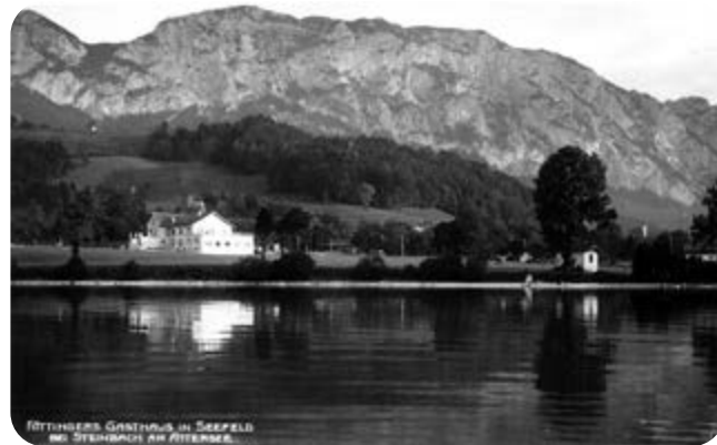
Historický pohled na Mahlerův domek (vpravo) na břehu jezera