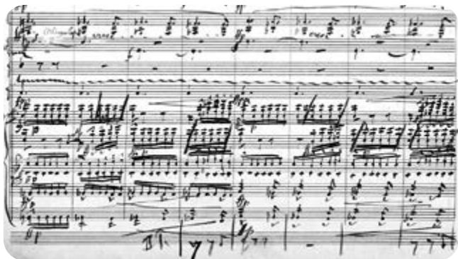
Autograf Druhé symfonie

ponoval na text ze sbírky Chlapcův kouzelný roh (Des Knaben Wunderhorn), a z písně Prasvětló (Urlicht) – tentokrát již v nepozměněné podobě i se zpívaným textem – učinil větu čtvrtou. Romantická sbírka lidové poezie Chlapcův kouzelný roh , kterou v letech 1806 a 1808 (s podtitulem Staré německé písně ) vydali mladí básníci Achim von Arnim a Clemens Brentano, Mahlerovi uhranula. „Všechno, co dojímaló jeho duši, tam bylo zobrazeno tak, jak to cítil: Příroda, zbožnost, touha, láska, loučení, smrt, radost, mládí, dětský žert a humor – to vše v něm žilo jako v básních, a tak také vytryskly jeho písně,“ poznamenal dirigent Bruno Walter. Fakt, že Mahler několik svých písní na texty z této sbírky využil i v některých svých symfoniích, jen dokládá jeho přístup k symfonické a písňové tvorbě coby rovnocenným žánrům. Dalo by se také říct, že jeho symfonie vzešly z písní, že písňovost je východiskem jeho symfonismu.