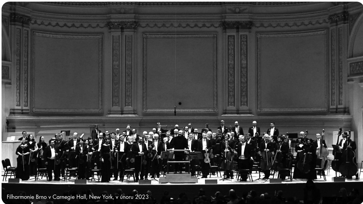
Filharmonie Brno v Carnegie Hall, New York, v únoru 2023

Kořeny brněnské filharmonie sahají do 70. let 19. století, kdy v Brně mladý Leoš Janáček usiloval o vznik českého symfonického orchestru. Dílo slavného skladatele 20. století je ostatně nejvýznamnější programovou položkou tělesa, které je považováno dodnes za jeho autentického interpreta.