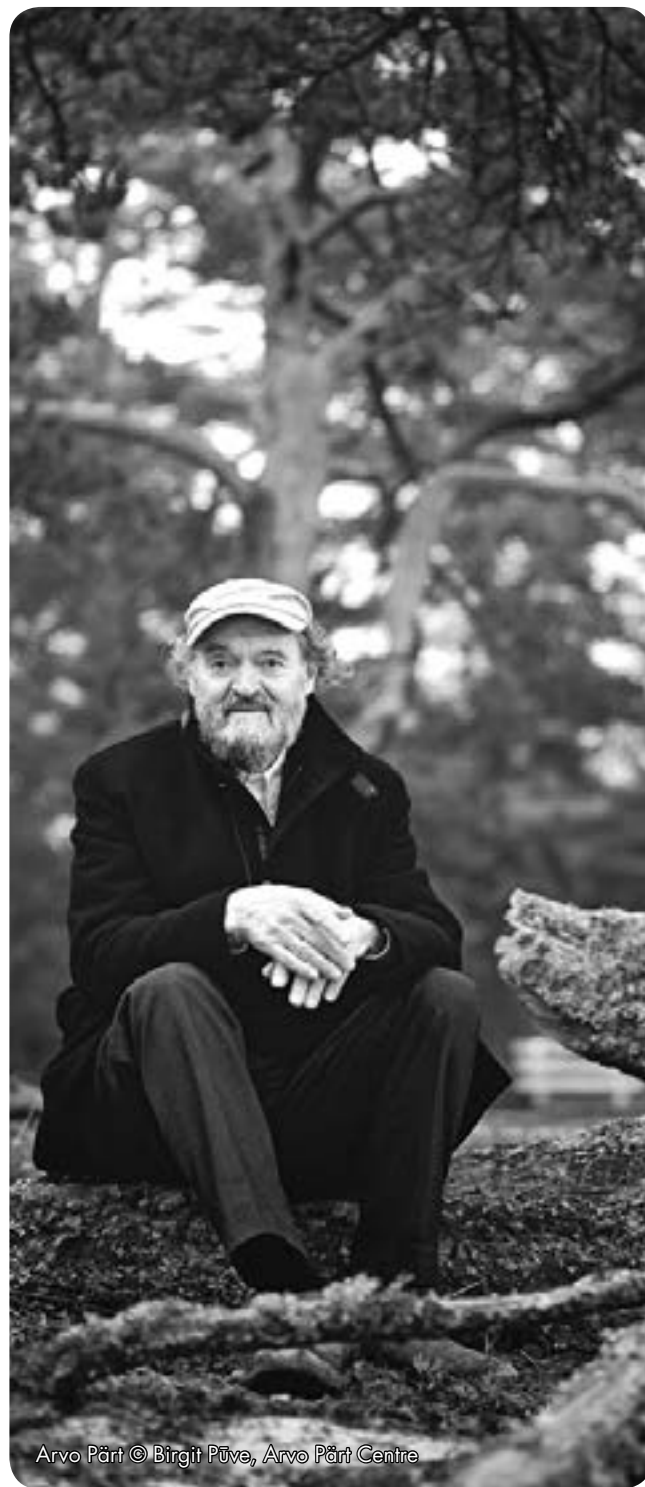
Arvo Pärt

Arvo Pärt (1935) byl jedním z prvních skladatelů na teritoriu bývalého Sovětského svazu, kteří svou pozornost obrátili k západoevropské moderně; ve své rané tvorbě uplatňoval seriální techniku, koláž, aleatoriku a další výtvarky tzv. Nové hudby. Jeho avantgardní období, které později sám přirovnal k jistému druhu nemoci, z níž se vyléčil, vyvrcholilo polystylovou kantátou Credo (1968). Poté se Pärt stáhl do ústraní, ponořil se do studia středověké hudby a po několik let téměř nekomponoval (jednou z výjimek byla Třetí symfonie z roku 1971, která naznačila Pärtův následující vývoj). Hledal... A našel. Dopomohl mu k tomu i úzký tvůrčí vztah s nově založeným legendárním (a dodnes činným) tallinským souborem pro poučenou interpretaci tzv. staré hudby Hortus musicus: Otevřel se před námi svět staré hudby, který nám dodal entuziasmus. Ta atmosféra sehrála roli porodní báby pro mou další hudbu. Tak začala vznikat Pärtova „stará hudba pro přelom druhého a třetího milénia“, nový styl založený na jednoduchosti, diatonice, statičnosti a inspirační opoře ve středověké hudbě. Pärt nazval tento styl tintinnabuli (z latinského tintinnabulum – zvoneček)