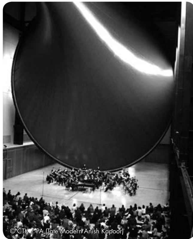
(Tate Modern Anish Kapoor)

metrů dlouhý artefakt ze sytě rudé plastové blány natažené mezi třemi ocelovými kruhy svým názvem odkazuje k antickému mýtu o satyrově, jež vyzval boha Apollóna k soutěži ve hře na flétnu a kvůli své troufalosti doslovně „prohrál vlastní kůži“, jež mu byla zaživa stažena. Kapoorův Marsyas , pravděpodobně největší skulptura, jaká kdy ve výstavním interiéru byla instalována, v letech 2002–2003 zcela vyplňovala prostor Turbínové haly ve slavné londýnské galerii Tate Modern. Byla koncipována tak, aby z žádného místa nemohla být zhlédnuta jako celek, uchovávajíc si tak svá tajemství a vyvolávajíc v divákově ohromení a stísněnosti současně, tedy to, co člověka provází na jeho pouti při pomýšlení na vlastní život a smrt.