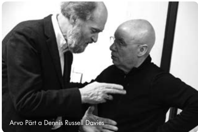
Arvo Pärt a Dennis Russell Davies

co ještě mohu v čase, který mi zbývá, dokázat. To, co jsem složil, je nářek, ale nikoli nad mrtvými, nýbrž nad živými, nad námi, co se potýkáme s bolestí a marností tohoto světa.