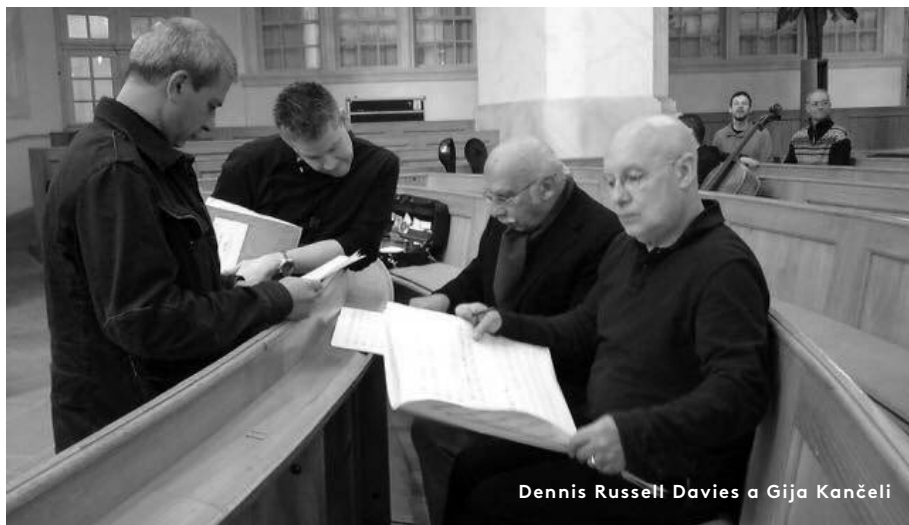
Dennis Russell Davies a Gija Kančeli